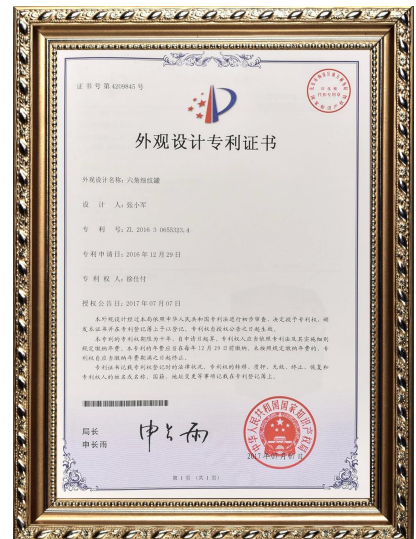
Bằng sáng chế số :201630655323.4