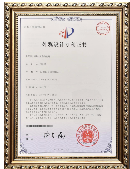
Bằng sáng chế&Số:20163065523.4