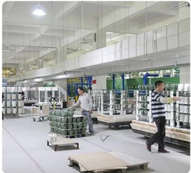
Quy trình công nghệ