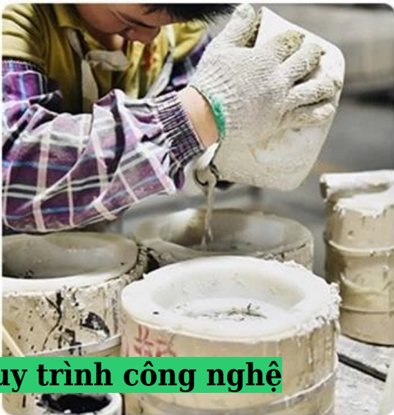
Quy trình công nghệ