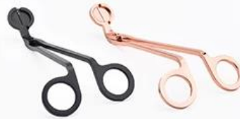
Wick Trimmer Cutter

.Adatto cho gia đình, khách sạn hoặc khu vườn