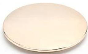
Zinc Alloy Cover