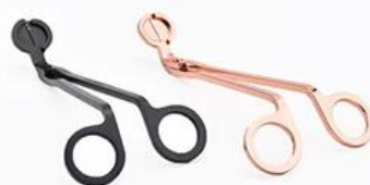
Wick Trimmer Cutter

.Adatto cho gia đình, khách sạn hoặc khu vườn