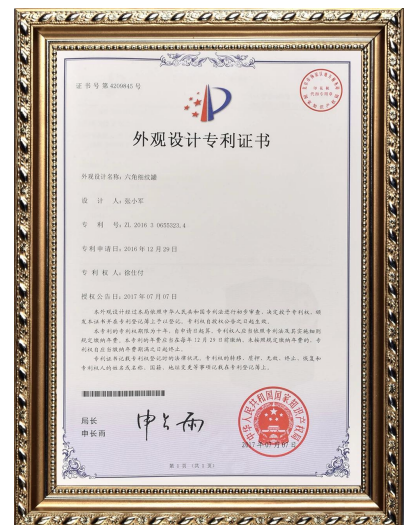
Số bằng sáng chế: 201630655323.4