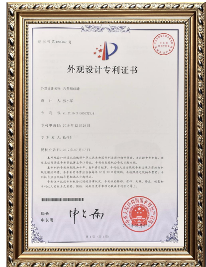
Bằng sáng chế số :201630655323.4