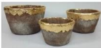
CS10026A-2 20x20x12.5cm CS10026B-2 17x17x10cm CS10026C-2 14x14x9cm