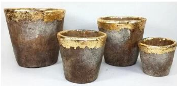
CS10025A-4 20.5x20.5x19.5cm CS10025B-4 17.5x17.5x16.5cm CS10025C-4 14.5x14.5x14cm CS10025D-4 11.5x11.5x10.5cm CS10025E-4 8x8x7cm