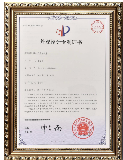
Bằng sáng chế&Số:201630655323.4