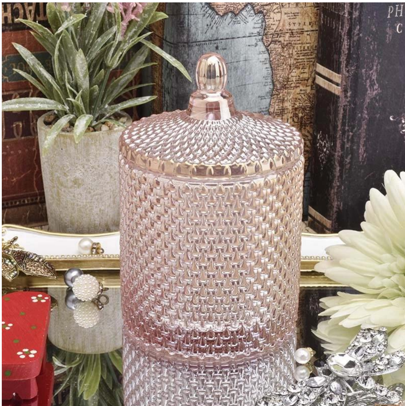
Range of the application