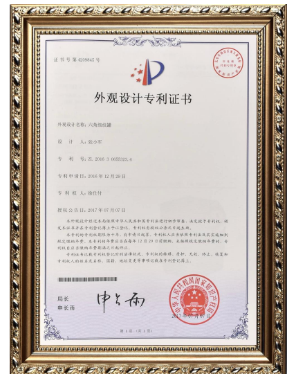
Bằng sáng chế số :201630655323.4