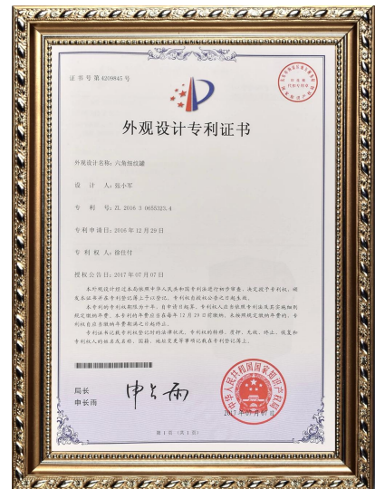
Bằng sáng chế số :201630655323.4