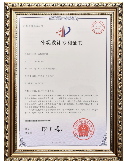
Bằng sáng chế số :201630655323.4